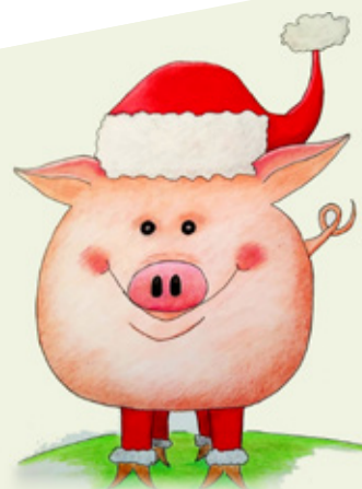
Illustration: SB E