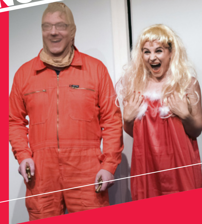
DER NACKTE WAHSINN

DER NACKTE WAHSINN Komödie von Michael Frayn